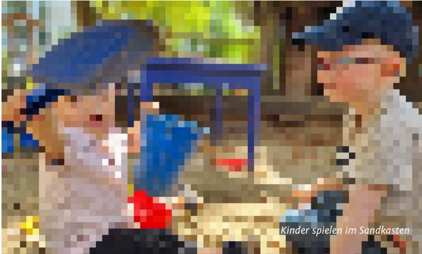
Kinder spielen im Sandkasten