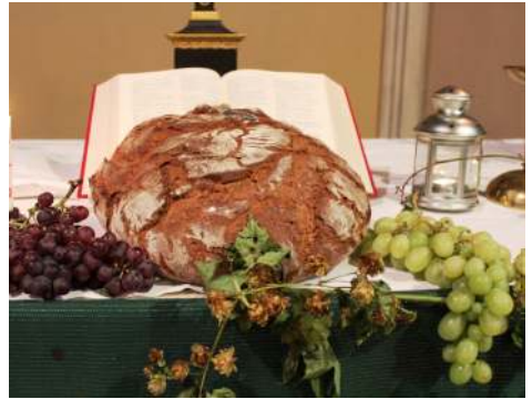
Erntedankaltar in Hoffnung 2017